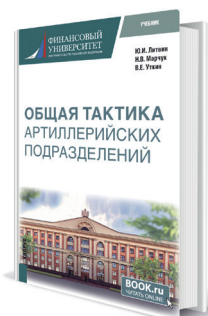
Общая тактика артиллерийских подразделений Авторы: Литвин Ю.И., Марчук Н.В., Уткин В.Е.