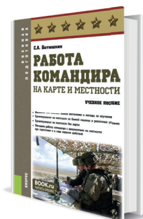
Работа командира на карте и местности Автор: Батюшкин С.А.

ИЗДАЕМ УЧЕБНУЮ ЛИТЕРАТУРУ ДЛЯ ВЫСШИХ ВОЕННЫХ УЧЕБНЫХ ЗАВЕДЕНИЙ И ВОЕННЫХ УЧИЛИЩ, ВОЕННЫХ УЧЕБНЫХ ЦЕНТРОВ