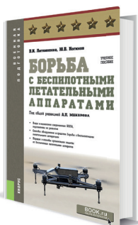
Борьба с беспилотными летательными аппаратами Литвиненко В.И., Ногинов Ю.В. Под редакцией Макарова А.П.