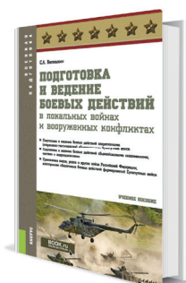
Подготовка и ведение боевых действий в локальных войнах и вооруженных конфликтах Автор: Батюшкин С.А.