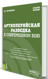
Артиллерийская разведка в современном бою Автор: Литвиненко В.И.