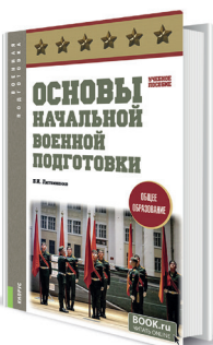
Основы начальной военной подготовки (общее образование) Автор: Литвиненко В.И.