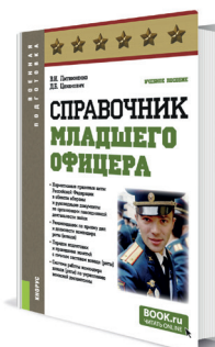
Справочник младшего офицера Авторы: Литвиненко В.И., Цеханович Д.Б.