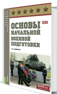
Основы начальной военной подготовки Автор: Литвиненко В.И.