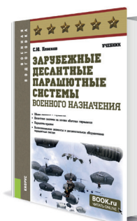
Зарубежные десантные парашютные системы военного назначения Автор: Плосков С.Ю.

ПРИГЛАШАЕМ ПРОФЕССОРСКО-ПРЕПОДАВАТЕЛЬСКИЙ СОСТАВ ВОЕННЫХ УЧЕБНЫХ ЗАВЕДЕНИЙ ПРИСОЕДИНИТЬСЯ К АВТОРСКОЙ ПРОГРАММЕ ИЗДАТЕЛЬСТВА «КНОРУС».