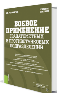
Боевое применение гранатометных и противотанковых подразделений Автор: Матвийчук И.В.