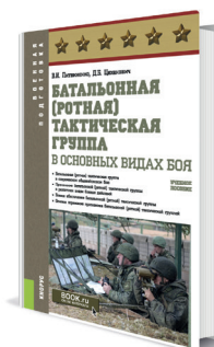
Батальонная (ротная) тактическая группа в основных видах боя Авторы: Литвиненко В.И., Цеханович Д.Б.