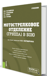
Мотострелковое отделение (группа) в бою Авторы: Матвийчук И.В. (под общ. ред.), Максимов Н.А., Хомич А.Г., Гуркин А.И.