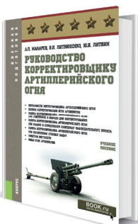
Руководство корректировщику артиллерийского огня Авторы: Макаров А.П., Литвиненко В.И., Литвин Ю.И.