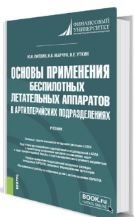
Основы применения беспилотных летательных аппаратов в артиллерийских подразделениях Авторы: Литвин Ю.И., Марчук Н.В., Уткин В.Е.